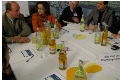
Starkes Engagement in den Gruppen